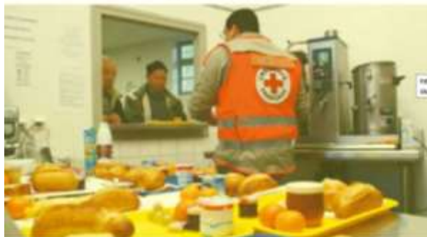
Distribution de repas par la Croix rouge.

Don aux associations : la générosité des Français au rendez-vous